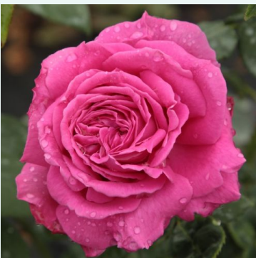
Madame Isaac Pereire