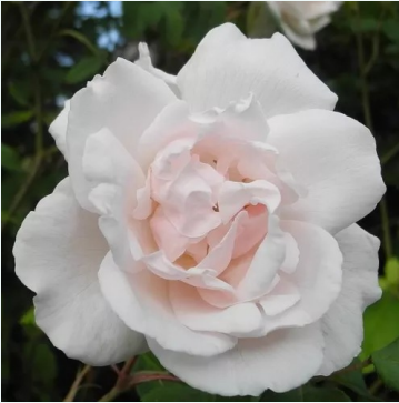
Madame Alfred Carrière