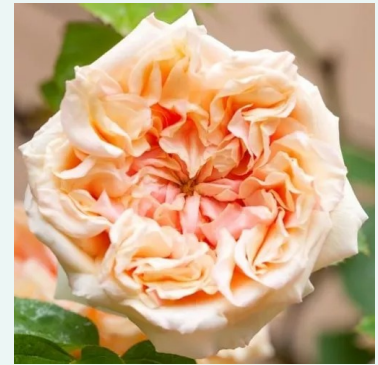
Gloire de Dijon

karmozijnrood - historische, bourbonroos 130-180 cm sterk, langhoudend geurende roos - vol, bourbonachtig Rudolf Geschwind